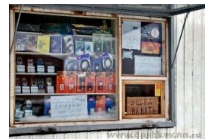
Всё правильно сделал