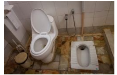
Компромиссный евроазиатский сераль в иранском отеле