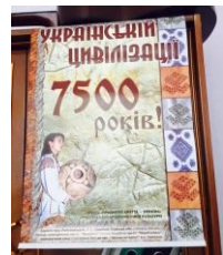
Сходи в музей, узнай, кто основал цивилизацию