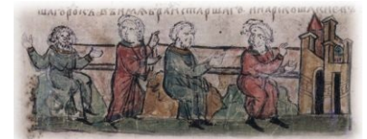
Улыбаемся и машем. Бородатая Лыбедь и её братья аплодируют основанию Киева. Радзивилловская летопись

Это первое появление взаимоисключающих параграфов в истории государства Украинского. Киев либо был основан полторы тысячи лет назад, либо был так основан гол-компанией во главе с Кием, ибо Кий и его братовья с сестрой жили в IX веке. Описание основания Киева находится в летописи «Повесть временных лет», которая написана существенно позже описываемых событий, и написано там такое: жили-были поляне, племя какое-то, из этого племени Кий сидел на одной горе, Шек на другой, а Хорив на третьей, а между ними летала сестра их Лыбедь и всех любила. Решили они основать город и основали, какие проблемы. А еще говорят, что Кий был переправщиком — держал мелкий и средний бизнес по переправе через Днепр, не удивительно, что город назвали в честь него. Впрочем, и до этой компании через речку переправлялись, и народ тусовался — в раскопках нашли и более древние монеты. В общем, оба варианта вероятны: и наличие переправы на месте Киева 1500 лет назад, и основание города Кием (что в переводе означает «рабочий»), но надо бы выбрать что-то одно.