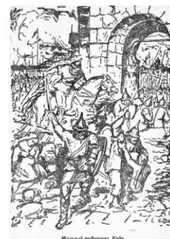
Из школьного учебника Степана Бандеры