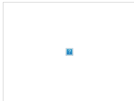
Крутая иномарка Шкода-100. «Запорожец», ну правда же