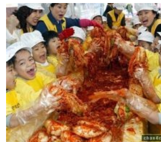
Национальная корейская нямка — кимчхи