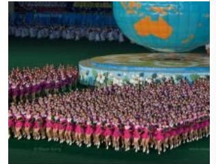
Парад марширующих лоли