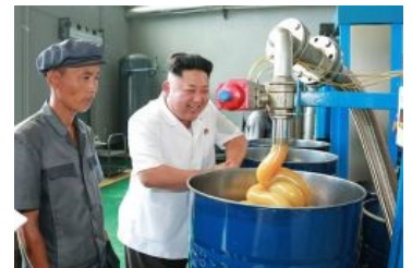
А тут уже повеселее