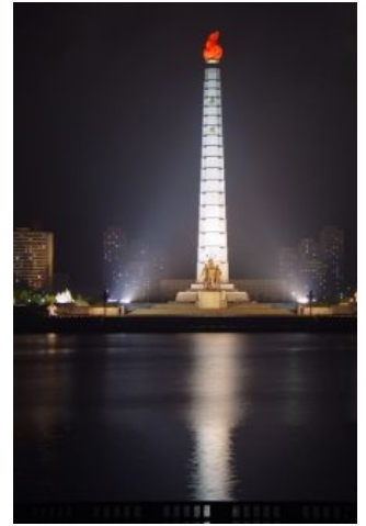
Монумент идеям чучхе в Пхеньяне