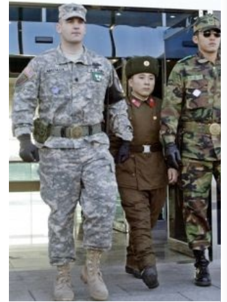
Слева направо: Солдат США, солдат КНДР, солдат Южной Кореи. Nuff said