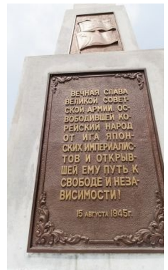
А вы говорите, не помнят!