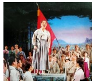
Ололо, ололо, «Море крови» залило!