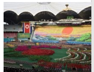
Да, это всё люди

Даже в холодную погоду наш Великий Руководитель, товарищ Ким Чен Ир ездит на машине