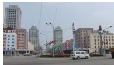
Пхеньян — это как СССР, только КНДР

Ну и, пожалуй, главный вопрос лишь в том, когда таки жажнет. Всё-таки