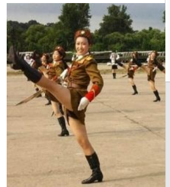
Корейская Нарядная Армия, 3- й канкан-батальон, боевая подготовка: отработка удара по яйцам панцшота