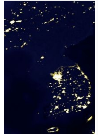
Две Кореи. Наглядное сравнение