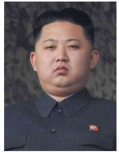
Лидер КНДР смотрит на тебя, как на своего подданного