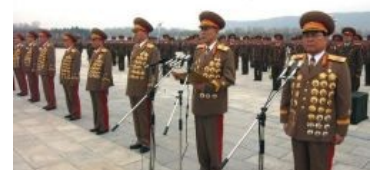
Брежнев соснул с проглотом