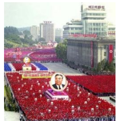
Парад в Пхеньяне: довольные участники построились в ряды и машут флажками