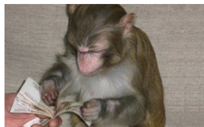
Та самая обезьянка подсчитывает свои чаевые за день...

Персонал: как правило, персонал живет там, где и работает. В нагрузку повар может быть также и дворником на прилегающей к