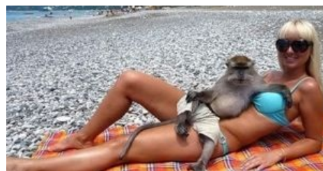
...а потом тратит их.