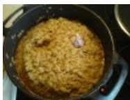
Плов (грузинской версии) рожей смотрит на тебя)