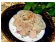
Бараньи яйца с лучком