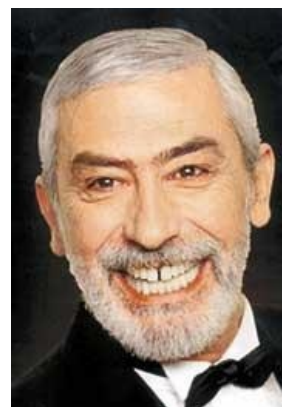
Рэstorатор и бараньих яиц приготовитель смотрит на твои яйца как на бараньи.