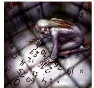
Сферический псих в палате мер-и веев