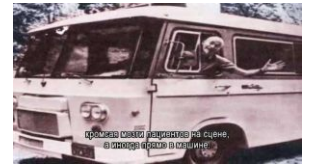
Уолтер Фриман делает вам ручкой.

Доктор Фердун Уолтер Фриман немного творчески доработал этот метод: зачем сверлить, если есть монтировка? Можно просто приподнять веко, загнать под глазное яблоко длинное шило и потыкать им пару раз (без анестезии, заметьте!), достигнув эффекта разрушения мозга, примерно как при лоботомии. Фриман развезжал по штатам на своём пативене и делал свои «целебные» процедуры направо и налево. Со временем, к сожалению, руки доктора стали дрожать, и в один прекрасный день один из пациентов умер прямо на операционном столе, за что докторишке лишили лицензии. Всего он провёл более 3500 операций, причём около четверти из них превращали человека в «овощ». Всего же лоботомию в течении 1940—1960 годов почувствовали на себе около 100000 человек. Как выяснилось в наши дни, Фриман калечил пациентам те участки мозга, которые отвечают за контроль импульсивного поведения. Так что отойдя от ступора после операции пациенты полностью слетали с катушек. Пруфвидео с целевщим пациентом .