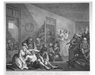
Бедлам глазами художника