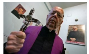
Экзорцист смотрит на тебя как на пациента.

Позже вместо инсулина стали использовать метразол, оказывавший схожее действие. Больные теперь лежали по кроватям связанные и дружно тряслись в конвульсиях. Тогда же был придуман и ещё один метод для уничтожения плохих клеток мозга — электрошок . Изобретателями его оказались два итальянских психиатра, бывавших на скотобойне и заметивших, что перед забоем свиней, чтобы те были спокойнее, к их вискам прикладывают электроды, подсоединённые к обычной розетке. После этого электрошок стали широко