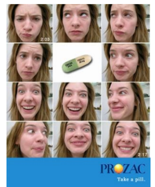
Прозак. Прими пилюльку.