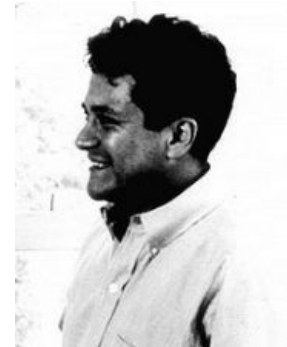
Кастанеда в зрелом возрасте