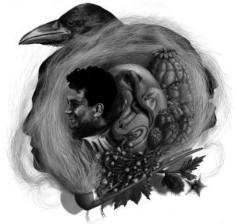
Карлос и его команда

Алсо, есть мнение, что Кастанеда включил вещества в первые две книги для того, чтобы поднять тонны бабла, так как в годы «психоделической революции», когда и были написаны эти книги, орды тогдашнего небыдла , жравшие вещества килограммами, стали основными покупателями «Учения дона Хуана» и «Отдельной реальности».