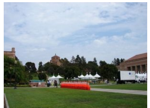
UCLA — университет, студентом которого был КК. Место силы