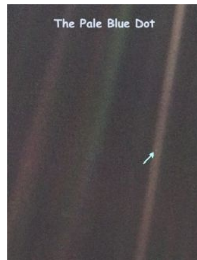
Почувствуй свою ничтожность [3]