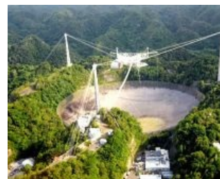
Тот самый радиотелескоп

систему, к ним прихреначили пластинки (не простые, а золотые ) с месседжем. И точно так же Саган стал во главе команды на разработке пластинок. На сей раз она была не тупо куском металла, а натуральным видеодиском. Сверху по традиции намалевали обратный адрес в виде положения Солнца относительно пульсаров, атом водорода и инструкцию, как этот грёбанный диск посмотреть. Внутри же засунули видосы, пикчи, звуки природы и человека. Бонусом приложили неплохой саундтрек из классики и джаза и обращение президента Картера.