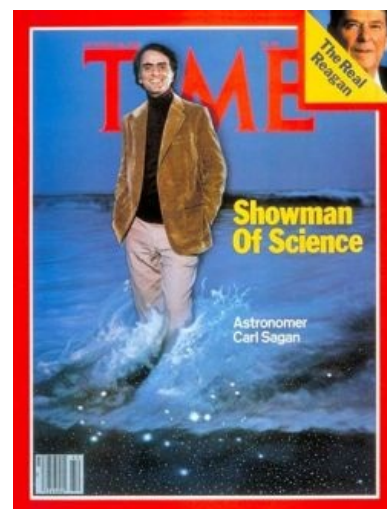
Был на обложке Time задолго до Путина