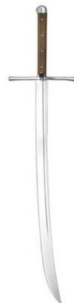
Готичная катана по-немецки