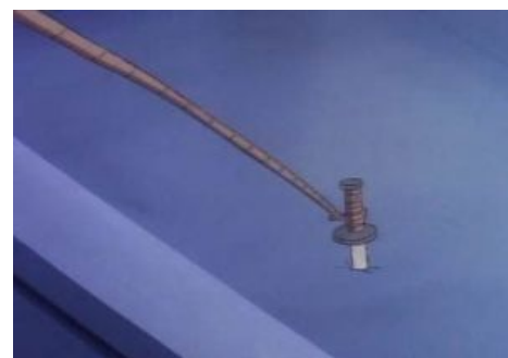
Леонардо знает толк в катанах!

Ковка мечей годами абсурдна также по сугубо практическим соображениям. Вспоминая историю обнаруживаем, что малюсенькая Япония постоянно сотрясалась междуусобными войнами. А в таких условиях ковать годами оружие мягко