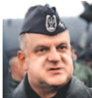
Главком ВВС Польши Анджей Бласик смотрит на тебя как на командира воздушного судна