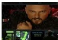
All your base are belong to us, mwah-ha-ha!