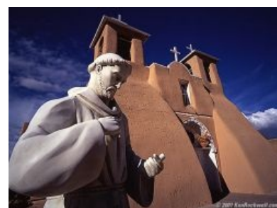
Классический стиль гения...