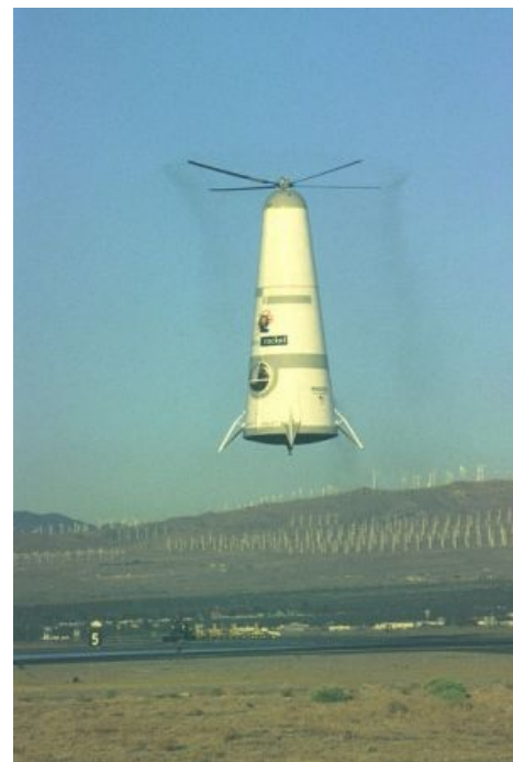
Правильный пепелац IRL

обозначение любого транспортного средства со времён набегов японских джипов на дальневосточные берега. На съёмках было два пепелаца, один — в натуральную величину, из куска хвоста самолёта, таскаемый краном на тросе, другой — маленький, пластиковый, для комбинированных съёмок, «летал» на тонкой рыболовной леске.