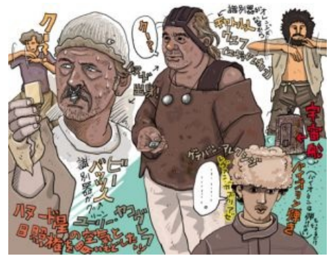
За коробок КЦ можно и на мунспике подумать