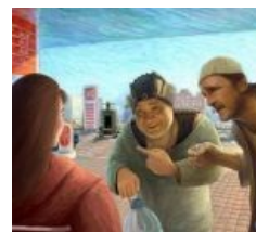
Прямо в картинах