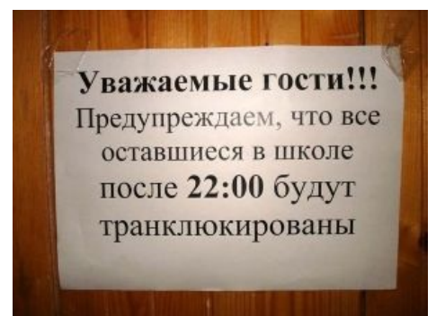
Ку или не ку?