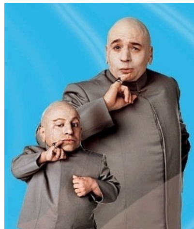
Некоторые фейлы становятся винами .