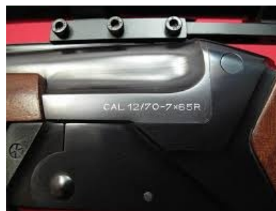
Допустимые калибры для сменных рёгов стволов Козлищщщщща

Kozlice переводится с чешского как ружьё , и к козлам (а тем более пиву) никакого отношения не имеет. Сам же CZ 584 относится к классу комбинированных ружей . Снизу у него нарезной ствол, а сверху гладкоствольный. Так же спусковой крючок нарезного ствола оборудован такой редкой фицей, как шнеллер — устройство, позволяющее сократить усилие нажима, необходимое для спуска с пары килограмм (как у обычного охотничьего спускового крючка) до нескольких сотен грамм, что облегчает прицельную стрельбу по неподвижным целям. Таким макаром, Козлище — универсальное в плане применения ружьё, которое можно использовать с одним большим зарядом дробы (для пальбы по уткам\змеям), и при этом, столкнувшись с медведем/заметив быка или кабана, иметь возможность пристрелить его прицельным в голову, имея гарантию того, что пуля разнесёт череп оного.