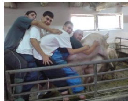
У них там своя атмосфера