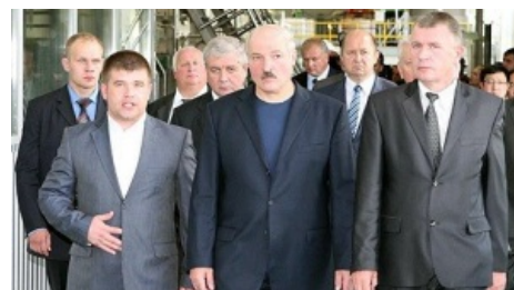
Главный колхозник и его свита