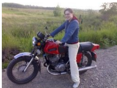
Сабж на мотоцикле

Сказати про життя, як це, Вася, було в житті... розумієте пацани? Всі пацани і тьолки... розумієте, в житті, Вася, буде всьо ніштяк, я вам... я вам за це атвічаю. Життя — цей вещь, яка, Вася... ніхто не паймає цій вещь... і цю вещь... тяжко пОняти. Її тільки можна пОняти, коли ти гулешь с пацанами і тьолками з якими ти знайомий давно... І це все, Вася, буде з нами давно знакове... панятно. Пацани, скажіть!..