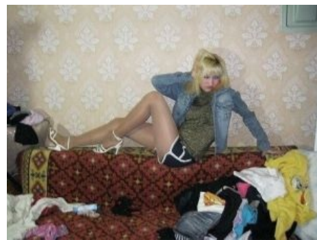
В привычной среде

При этом интересный факт, пригодный для изучения британскими учеными, заключается в том, что независимо от времени суток при приветствии селюки используют устойчивую форму «добрый дэнь» (калька с пшец. "Dzen dobrzy" или что-то в этом роде). Говор данных субъектов вызывает кровь из ушей даже тогда, когда они пытаются разговаривать на чистом украинском. Анонимус-кун с западной Украины (что, впрочем, не показатель знания чистого украинского языка) наблюдал, как эти апачи после приезда в город, пытаясь казаться круче, начинали говорить (еще одна их особенность — пытаться выделиться и вызвать зависть у окружающих странным образом), что, СУКА, просто в секунду вызывало рвоту.