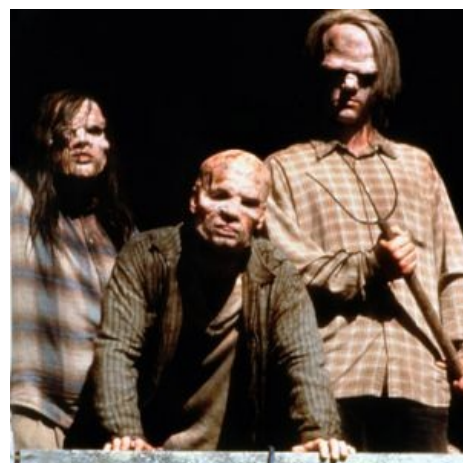
Молодая семья выражает

Игорь Растеряев. Комбайнёры - Combiners. Комбайнёры