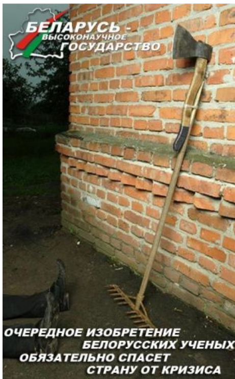
Вклад колхозников в белорусскую науку

мужыки-калдыры понаехали из своих засранных глухих деревень, дабы освоить под засирание новые территории . Здесь уж долгая история. После ВОВ практически все крупные бульбингемские города были разрушены чуть менее чем полностью, особенно столица . Надо было их как-то заново отстраивать и восстанавливать население. Примечателен тот факт, что в довоенном Минске проживало 238,9 тысяч жителей, а уже к 1960-му — 509 667. Любопытно, что когда коснулся вопрос строительства Минского метрополитена в 70-е, был дан запрос советской верхушке [2] . Те ответили, что только город с миллионным населением имеет право на такой вид транспорта. Поэтому правительство БССР пошло на беспрецедентные меры — всеми средствами стимулировало увеличение населения Минска, набирая его, естественно, с колхозов. Вот так вот, а в этих ваших Вильнюсах и Ригах на такое местные власти в те времена не шли. Поэтому там и сейчас нет метро, зато города сохранились в более-менее божеском виде, незасранным по крайней мере, с культурными жителями, так как количество свежепонаехавших дикарей на квадратный километр там значительно ниже.