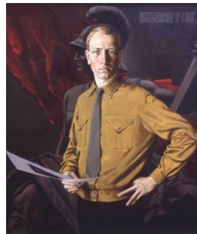
Холодный и суровый Васильев

«Еще на стенах были картины художника Константина Васильева. Эти картины, как я позже окончательно определил, — фирменная мультка всех сумасшедших, помешанных, как правило, при этом еще одновременно либо эпизодически на многом: русском язычестве, скандинавской мифологии, гитлеризме и всем, что связано с Третьим Рейхом, какой-нибудь славяно-горицкой борьбой. Иногда они еще для пущей комплекции увлекаются сатанизмом, готикой, зороастризмом, Толкиеном и раскопками могил времен Великой Отечественной. Любящие читать — читают Ницше и Адольфа Гитлера.»