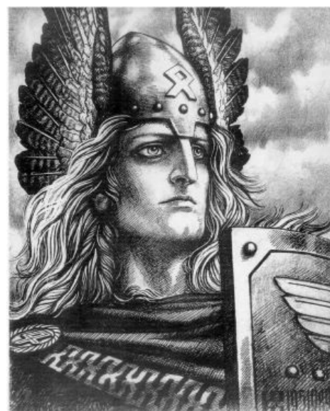
Нордично и героично