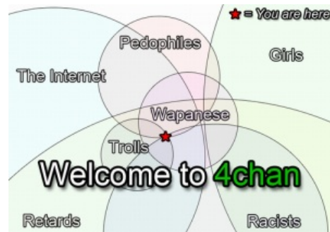
Мегаёж о сути Форчанга

Название пошло от Джима Коллинза описавшего концепцию в своей книге «От хорошего к великому. Почему одни компании совершают прорыв, а другие нет». Суть в сравнении маркетинговых стратегий начинающих компаний с тактикой нападения лисицы и способом защиты ежа. Хитроумная лисица использует множество различных способов, чтобы напасть на ежа, но он всегда использует одну и ту же тактику защиты — еж скручивается в клубок и выпускает иголки, и все старания лисы не приносят никаких результатов. Множество компаний следуют тактике лисицы, пытаются привлечь потенциальных покупателей всеми доступными способами. Но успеха достигают организации, применяющие концепцию ежа — они фокусируют все свои усилия придерживаясь одной наиболее эффективной маркетинговой стратегии. Сама диаграмма к «ежу» никакого отношения не имеет, он просто использовал её для наглядной иллюстрации. Такие дела.