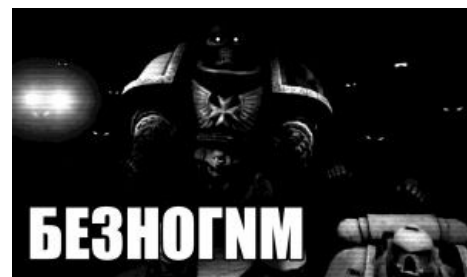
Изображение, полученное с визора зараженного сервитора

Криптек Авато Рпхаг наблюдал, как безмолвные фигуры его братьев надвигаются на позиции космодекантов, защищающих руины древнего святилища. Опыт миллиона лет подсказывал, что они обречены. Защищающиеся были отрезаны от внешнего мира и помощи ждать было неоткуда. Авато поднял свою длань, покрытую резными рунами некротир. Повинуясь сигналу, Бессмертные дали залп из тесла карабинов и количество защитников сократилось на половину. Криптек поднял вторую руку и небо озарила вспышка ослепляющего света. Бессмертные дали еще один залп, добивая беспомощных противников.