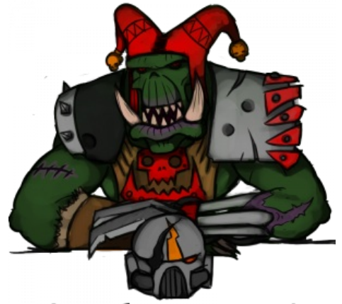
Анус себе потуши, сквиг!

Падъезжаем мы к чилавечьюму лагерю, и тут Галка как крикнет в рацию "Атакованы превосходящими силами противника! Вынуждены отступить!" Ну чиста па чилавечье, как космобанка, пока ей шлём не атарвёшь! Ну чилавеки забегали, засуетились, сразу варота в лагерь аткрыли. Мы втехали, сразу из вагона павыскакивали. Чилавеки аж от удивлению абассались! Штобы орки, да на ихнем вагоне, да в ихний лагерь? Сразу в Кодекси Усрартес рыться начали. Ани ваабце, эти синемарины, чуть что - сразу в кодекс... Мазгов совсем нет, думать нечем! Можит, патаму оне в бой без шлёмов идут! Ха-ха-ха! Ну начала мы тут чилавецов стрелять и резать. Дробовец из сваиво драбадана в воздуха шарахнул. Я иму - "Пачиму, ни па чилавекам?" А он мне - "А если я па чилавекам выстрелю, как наши паймут, што атаковать пара?" Ха-ха-ха, каббудта если выстрил ни в неба, иго никто ниуслышит! Хы-гы-гы! А тут Оруцый Зад подошёл. Вышел, он, значит, с парнями из кустов и как заорёт сваей гаваряще жопой "Нет бога кроме Бога Истинава Йумора, а Питроз - Прарок Иво!" И тута усё и завертелосся...»