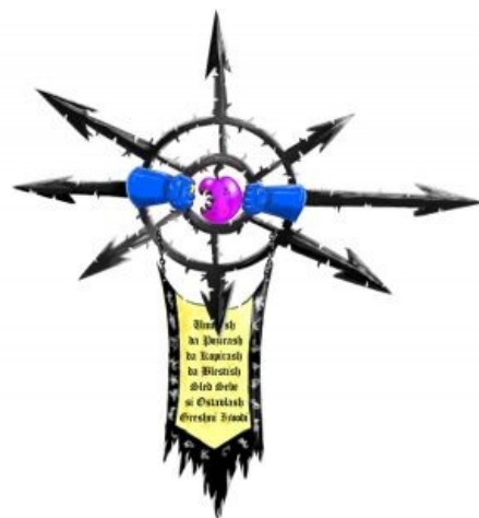
Личное знамя Азисуса