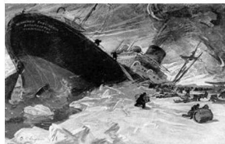
Челюскин в челюстях льдов

Итог — 104 человека остались сосать хуйцы на льду, пока их эвакуировали на протяжении двух месяцев. После такой хуйты пошло выражение «как челюскинцы на льдине». Потерь по счёту — 0, так как единственного зашибленного бочками во время окончательного потопления лохани боцмана (неудачно полез на пароход добыть ещё какой-то полезной хуйни) сменила родившаяся прямо в ходе рейса дочка одной из зимовщиц .