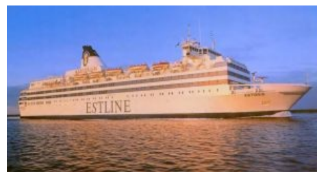
«Эстония» грандиозна и нетороплива

1994 год, ночь с 27 на 28 сентября. Эстония — соединяла паромным сообщением Таллин и Стокгольм. Вечером указанного дня взяла на борт 989 человек и вышла из Таллина, но в Стокгольм не пришла. Возникли вопросы — куда мог подеваться паром в бушующем море при ветре всего 20 м/с? Единственной весточкой от «Эстонии» оказалось короткая передача по радио в стиле SOS, фоновым шумом во время которого была слышна противотуманная сирена, дабы взбодрить задремавших пассажиров, а голосом было сообщено, что крен у парома порядка 20-30 градусов .