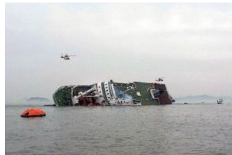
Се ля ви

2014 год, 16 апреля. Севоль — южнокорейский паром, под завязку наполненный школотой, плыл с превышением скорости на экскурсию к местной достопримечательности — острову Чеджу. Внезапно он врезался во что-то, скрытое под водой. А может и не врезался — а может это дворник был , типа мины или мимо крокодившей северокорейской или даже американской/ собственной подлодки. Однако вне зависимости от конкретной причины, суть происшедшего вполне ясна: команда на мостике заложила на скорости крутой поворот, перегруженное судно сильно накренилось — и пошла писать губерния.