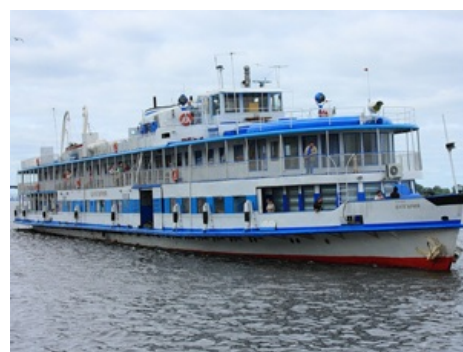
«Булгария» до того как

Из-за полного отключения электричества (тупо залило водой), несогласованной работы команды (учений никто никогда не проводил) и паники выжить удалось только тем, кто находился непосредственно на палубе или сумел выбить окна. Удачно приглашённые в музсалон детишки были обречены. Однако кошмар на этом не закончился, так как помощь не то что бы не приходила, а упорно проплывала мимо. Оказавшиеся в воде люди заинтригованно проводили взглядом два судна «Арбат» и «Дунайский-66» — ни одно из них не остановилось. А к тому моменту, когда стали что-то подозревать, появилась «Арабелла» с капитаном, стремящимся к славе, который сказал что-то вроде «идите, парни, я сам тут д'Артаньян ». Скоростной теплоход «Метеор» все же остановился и даже подобрал парочку, пока его счастливые улыбчивые пассажиры, презрев непогоду, снимали на мобилы остальных смешно барахтающихся человечков. Вообще, все эти события на количество жертв практически не повлияли, ибо все, кто в итоге утонул, погibli вместе с пароходом раньше.