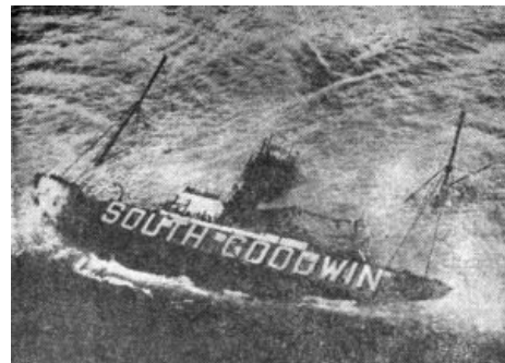
«Южный Гудвин» досверкался

1954 год, 26 ноября. Южный Гудвин — британский плавучий маяк, который был призван оберегать корабли от трижды злобучей поебени, проклятой всеми моряками этого глобуса — мели Гудвина (он же «Великий пожиратель кораблей», он же «Песчаный хамелеон»), расположенной в проливе Ла-Манш и любящей захавывать корабли каждый год пачками. Есть мнение , что большинство судов там гибло в основном из-за похуизма капитанов, полагавшихся на солёный морской авось и «хуйня, проскочим». Для таких особо одарённых и поставили «Южного Гудвина». Вы спросите, в чём лулз? А в том, что «Великий пожиратель кораблей» в ночь с 26 на 27 ноября 1954 года, пользуясь темнотой и штормовой погодой, разбил нафиг эту мигалку, дабы не мешала дальше пожирать. Не помог даже десятикратный запас прочности якорных цепей!