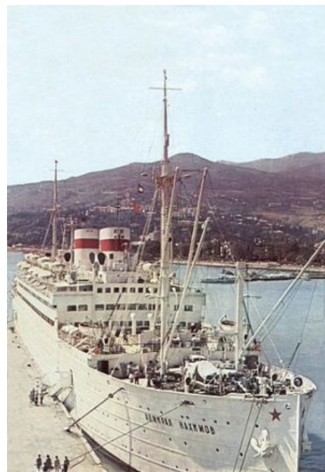
«Адмирал Нахимов», весь в белом источает нордически суровый дым

2011 год, 10 июля. «Булгария» — круизный двухпалубный теплоход 1955 года выпуска и чехословацкой постройки, более пятидесяти лет проробоздивший просторы Волги-матушки без единого капремонта. Что характерно, построен на той же верфи, что и вышеописанный «Суворов». В означенный же день он вышел в очередной круиз по Куйбышевскому водохранилищу, взяв с собой