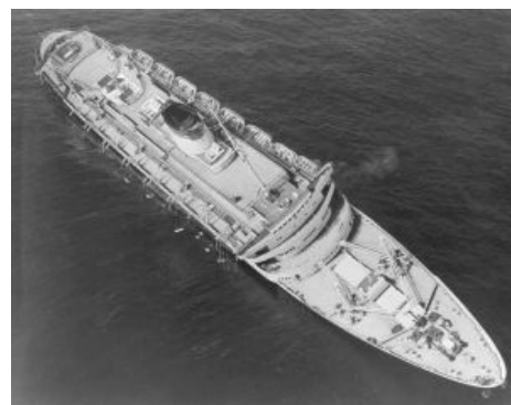
«Андреа Дориа» тонет

1956 год, 26 июля. Андреа Дориа — знойный итальянский лайнер, решивший поискать свиданий в столь романтическом тумане. Те же мысли посетили горячий шведский экипаж корабля «Стокгольм». Когда их взгляды соединились, расстояние было уже критическим, плюс оба корабля завернули в одну сторону, что закончилось страстной встречей двух одиночеств. Что примечательно, пароход был прекрасно оборудован новейшими навигационными приборами, и на локаторе встречный пароход прекрасно видели. Но технология использования РЛС для предупреждения столкновений еще не выработалась (в те годы радары еще многим были в новинку), капитан слишком много смотрел в экран и слишком мало в окно и на карту, в результате чего утратил связь между картинкой на экране и реальностью, именно после этого случая психологи породят новый термин для этого явления — «радиолокационный гипноз» (который просочился даже в sci-fi, «навигатора Пиркса», например).