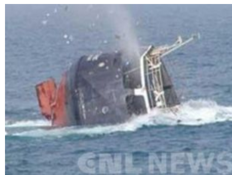
Не «Булгария», но тоже эффектно