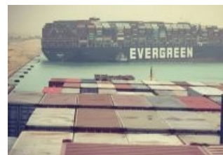
«Ever Given» во всей своей красе.

1905 год, 14-15 мая. Цусимский пролив — крупнейший позор Российского флота за всю его историю