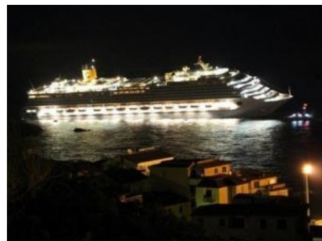
«Коста Конкордия» тонет с шиком

Итог — двое пропали без вести и отправились, видимо, кормить рыбок, 30 ушли в том же направлении (в том числе пятилетняя девочка), остальные спасены. До начала 2015 года никакой внятной инфы по Скеттино не было, но потом его таки отправили на 16 лет за решетку. Еще трём людям дали по два года, а, как подсказывает Педивикия, в Италии такие сроки обычно смазывают. Коста, видимо, обидевшись на столь малое число жмуров, продолжает держать марку: в феврале 2014 во время работ по её подъёму ислам принял один водолаз. В конце июля 2014 посуду таки подняли и отбуксировали в Геную, где