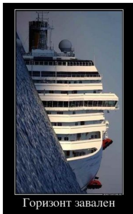
Итоговое положение судна