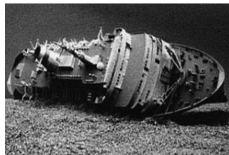
«Михаил Лермонтов» на дне.