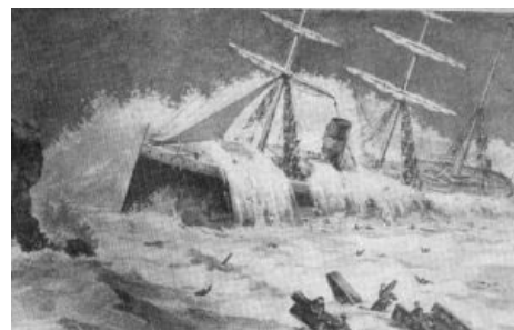
Атлантика против «Атлантика»

Итог — 547 принявших ислам. Среди спасённых ни одной женщины, и всего лишь один ребёнок, спасшийся, наверное, только благодаря особой уличной магии Дэвида Блейна. И статус самой страшной морской катастрофы, сохранявшийся вплоть до гибели «Титаника».