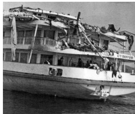
Суворову снесло крышу

Он ощутил удар. Теплоход замедлял движение. Владимир Петрович выскочил из каюты и бросился наверх по трапам, Перед последним, ведущим на верхнюю палубу, отпрянул. Сверху сплошным потоком лилась кровь. Пересилив себя, пошел вверх. Увидел ужасное. Горы окровавленных шевелящихся обрубков тел . Рядом лежала белокурая девушка. Обеих ног у нее не было, но она дышала еще и смотрела на него безумным взглядом. Отчетливо произнесла: «Скажите маме, что я жива...» И тут же умерла.