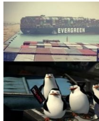
Улыбаемся и машем.