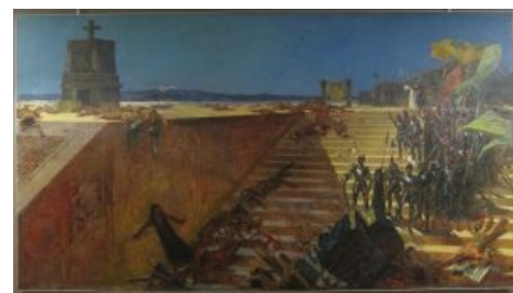
Торжество христианской справедливости