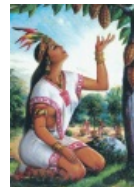
Ацтекская ванилька и какао - две вещи, которыми мы обязаны Кортесу