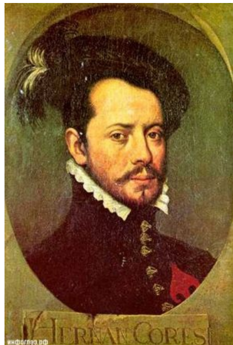
Кортес смотрит на тебя как на ацтека

Как и его славный соотечественник, храбрый Дон Кихот Ламанчский , происходил из идальго, то есть дворян. По современным данным, доход семьи Кортесов соответствовал их социальному статусу. По, опять же, данным современных исследований останков, был крепкого телосложения, но невысокого роста, хромал с рождения на правую ногу. Не отличался особой любовью к матери, называя ее « суровой и скаредной особой ». Тем не менее, впоследствии (уже в должности губернатора) взял ее с собой в Мексику, где старушка и склеила лапы, не выдержав акклиматизации (впрочем, злого умысла Кортеса в этом не было: в те времена такое слово еще не было известно). Был близок с отцом, воспитывающем сына в истинно аристократическом духе. Получил отличную фехтовальную подготовку. Благодаря благу своего любящего родителя, был определен в университет Саламанки. В учебе отличался усердием, свободно владел латынью (в те времена это был аналог современного английского) и баловался написанием текстов и стихов на этой самой латыни.