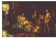
Куаутемок предается удовольствиям