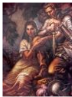
Кортес и его наложница Марина