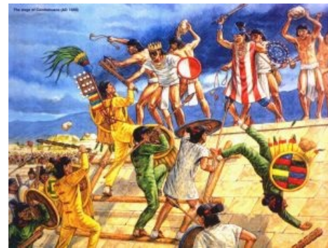
Бравые ацтеки обижают тласкаланцев

Тем временем Кортес наугад плыл на запад. На первой же стоянке у острова Косумель он легко переубедил местных майя, что лучше им иметь одного единственно верного бога. Видя такую слабую религиозность и воодушевившись, но не найдя золота, Кортес идет дальше вдоль побережья. В одном из местных селений, Табаско, откуда и пошло название жгучих перчиков , он захватывает в плен свой самый ценный трофей: наложницу Малинче (Марину). Ставшая переводчицей конкистадоров она в значительной мере поспособствовала вознесению на вершины успеха Кортеса, без зазрений совести предав своих соотечественников. Деликатные обстоятельства этого поступка и его причины художественно изложены в книжке Г. Р. Хаггарда «Дочь Монтесумы».