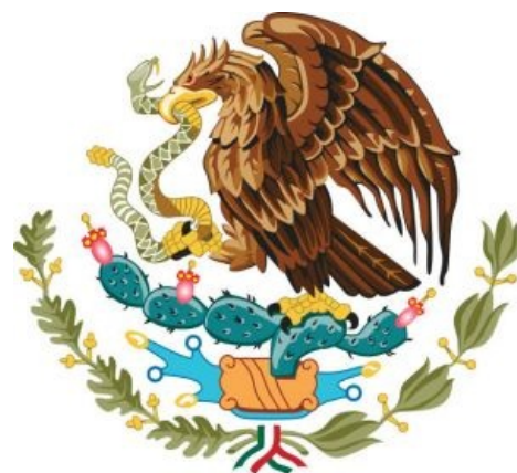
Брутальный мексиканский герб

Ацтеки не являлись аборигенами Мексиканской долины, а понаехали из глубин Американского континента, сразу попав в анальное рабство к местным , не одобрявшим такого нашествия. Так как историю пишут победители , то этот период «дикий» жизни без собственного государства упомянут весьма вскользь в ацтекских источниках. Свою будущую столицу, Теночтитлан, ацтеки должны были основать в том месте, где по пророчеству на кактус сядет орел со змеей в клюве (сей символ, кстати, стал гербом Мексики). Так и сделали. Поначалу гордый народец не спешил скидывать с себя ненавистное иго , но в результате скатывания в известном направлении своих хозяев поднялись с колен и стерли паханов в историческую пыль. Как и в случае с Москвой, ацтеки не всегда шли войной на соседей, чтобы сделать их частью своего государства. Где-то подкупами, где-то уговорами, а где-то просто демонстрацией силы ацтеки потихоньку выпнули из долины всех конкурентов.