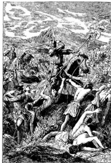
Кортес дает понять, кто должен победить

А дальше были лавры победителя, громкие пафосные слова благодарности от короля и сотни зависти от его прихвостей. Наш герой, почти всю жизнь проживший с шилом в жопе, не смог сидеть на месте и организовал еще несколько экспедиций за свой счет в Гватемалу и Гондурас , вернувшись оттуда несолоно хлебавши. Последние годы Кортесу приходилось превозмогать многочисленные козни завистников, окончательно подорвавших доверие монарха к наместнику «Вилле-Оахака». В результате не менее