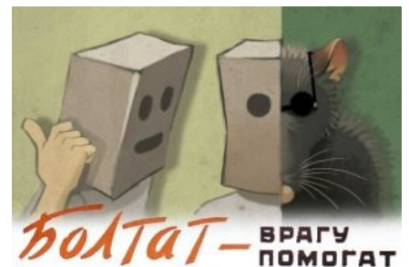
Никогда не знаешь, кем он окажется на этот раз...