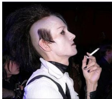
Ещё немного Ксайлика

Какое-то время персонаж пытался зарабатывать на « Балтику », обучая нубов работе с музыкальным софтом . Точнее — пытался заманить хотя бы одного нуба в свои пидорские сети, ибо учиться музыке у человека, который никуды не умеет играть, а также «получить доступ к его персональной коллекции сэмплов и vst-инструментов» — кому это, нахуй, может быть нужным?