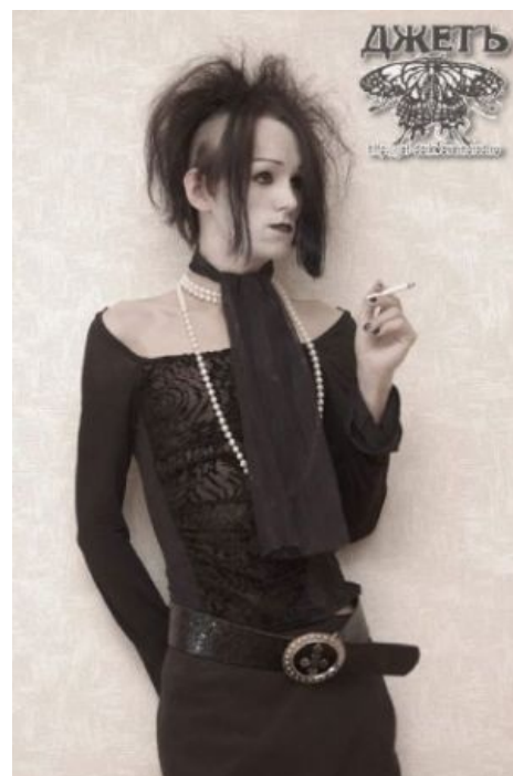
Ксайли такой недерастичный андрогинный

Прогуляйтесь по ссылочкам внизу. Понравилось? Так вот, это не стёб и не прикол: китайская самоиграйка, сраный картавый вокал,