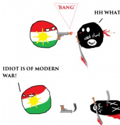
Kurdistanball и ISISball