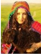
Курдская няша с ягнёнком