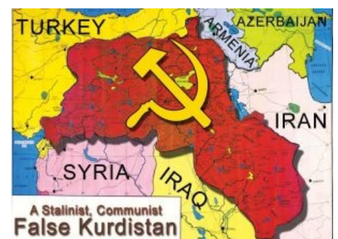
Курдистан глазами турков и арабов