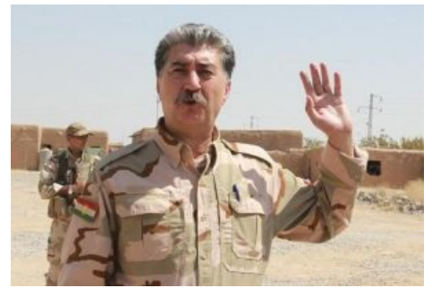
Хусейн Виссарионович, курдская версия дяди Кобы

Подобная левацкая идиллия, а также активная и успешная борьба против ИГИЛ привлекает в их отряды великое множество добровольцев со всего мира, образовавших нечто вроде интербригад . По этой же причине, однако, очень озабочены турки, снарядившие против курдов две военные экспедиции при активном участии местных исламистов. В ходе последней из них Россия, доселе благосклонная к курдам и принимавшая у себя их посольство, неожиданно вывела миротворческий контингент из региона (видимо,