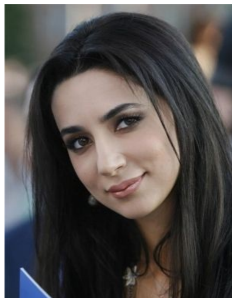
Зарифа «Зара» Мгоян

Личинка курдского человека ставшая известной благодаря своему утоплению в широких водах Средиземного моря. Поздним летом 2015 одна курдская семья из Сирии, уставшая от ослоббли, ИГИЛа и американских гуманитарных бомбардировок, пожелала вкусить радостей загнивающего европейского гомосексуализма и фастфуда. В Европу плыть было решено на дырявых лодках из палок и говна, отчего не все смогли доплыть до берега. Айлан оказался в числе сих счастливцев, и даже более того, его хладный труп был обнаружен журнашлюхами, которые немедленно пустили фото тела в печать, какбэ намекая, что гейропе нужно больше беженцев. Впрочем, не все пустили скупую слезу сочувствия. Некоторые лягушатнические газетенки выпустили карикатуры на тему того, что христиане могут ходить по воде , а вот муслимы — нет.