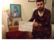
И умудряются против сексизма выступать