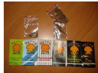
Альтернативный способ расширения сознания

«За время второго цикла моего ученичества дон Хуан ясно дал понять, что употребление курительной смеси являлось необходимым условием для того, чтобы «видеть» . »