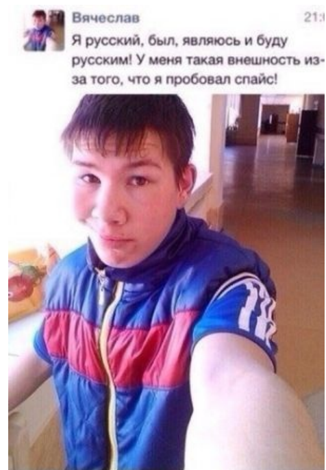
Хочешь стать таким?

Только вот вся фигня в том, что информации ни об этих смесях, ни о находящихся в них каннабиноидах, пока практически нет. Так что ты сам являешься источником информации, пробуя эти соединения. Что потом будет — векрытие покажет — станет информацией для других.