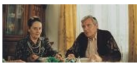
Профессор вот-вот раздаст Ване пиздюдей