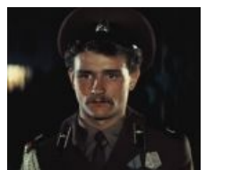
Светлое армейское будущее из Афгана смотрит на ГГ