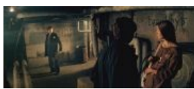
Я тут мимо проходил, а вы ебаться собрались