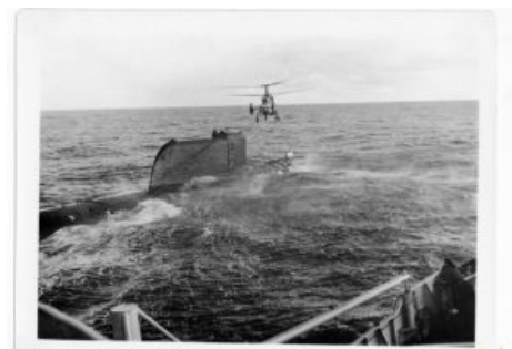
Экипаж помощи аварийной атомной подводной лодке просят в "К-19" 24.02.1972 - Фото с полета БПК-104 "СБ-38"

горючее маслице при касании с электроприбором для дожига угарного газа таки воспламенилось. 24 февраля 1972 года началось возгорание в девятом отсеке, огонь на мягких лапках подбирался к пульту управления главной энергетической установки, и ГЭУ была заглушена. В десятом отсеке задрайлись 12 человек, которые 23 дня дышали тем, что пошлет ТНБ и экипаж через трубопровод для дифферентовки лодки. Воды было мало, света, связи и еды не было совсем. На помощь подошли сухогруз «Ангар-лес», крейсер «Александр Невский» и другие. Ситуация крайне осложнялась штормом, но тем не менее вертолет с БПК «Вице-адмирал Дрозд» эвакуировал с К-19 сорок человек. Остальные перелезли на спасательный буксир. Всего погибло тридцать моряков.