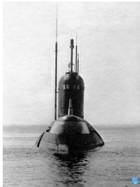
Смотрит на тебя как на американца...

15 ноября 1969 года во время очередного похода, К-19 меняла глубину, и убрала носовой частью американскую ПЛ «GATO». Оказалось, что американцы вели подводную разведку в Баренцевом море, на берегах которого коварно расположилась Империя Зла. К-19 же, хоть и с повреждениями, осталась на плаву и вернулась на базу. Позже стало известно, что командир торпедного отсека GATO с криком «русские идут» был готов торпедировать К-19, но командир Бухард оттащил ретивого офицера от «кнопки», тем самым, возможно, сэкономив несколько миллионов жизней. Именно с тех пор в ВМФ США ввели запрет на самостоятельные решения офицеров об атаке без разрешения на то командира судна. А на К-19 никто не пострадал, win.