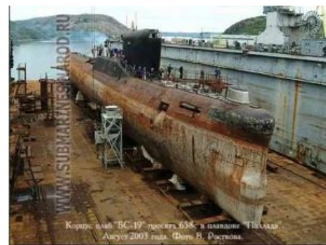
Последнее прижизненное фото