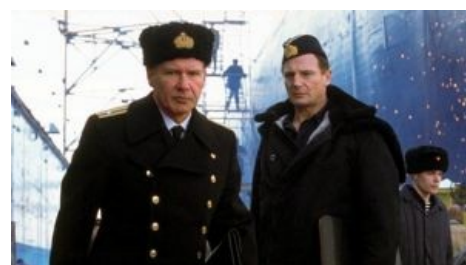
Хан Соло и Квай-Гон спасут мир