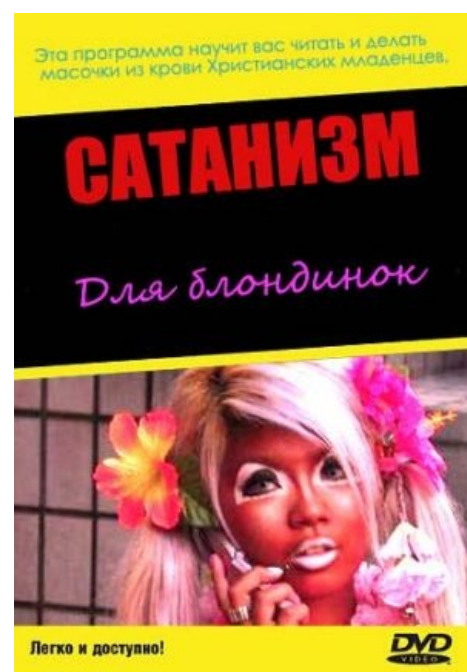
Пособие для эстеток