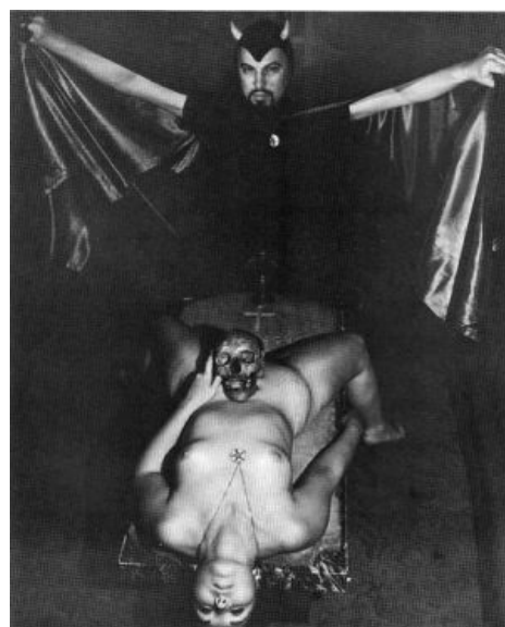
Антон Никоому не известный схожий танцор, в фильме «Ребёнок Розмари»

Сатана у ЛаВея (в отличие от христианской своей архангельской сущности) рассматривается как одна из сил , воздействующих на наш мир. С христианским Сатаной архангелом херувимом-лузером это переключается только в эгоистическом отношении к окружающему миру, так что бида-бида — библию ЛаВея под копирку не передирал, как бы того некоторым не хотелось.