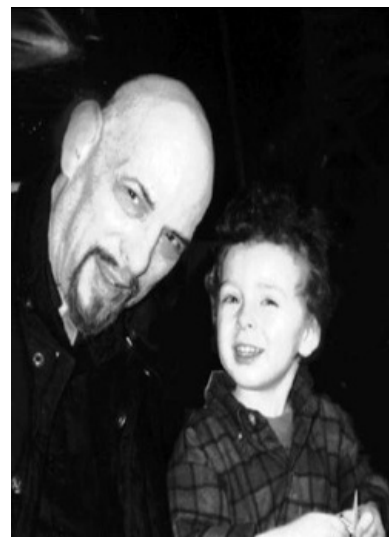
Папа и сын. Смотрят на тебя, как на ЕДУ ! Оба

Автограф. «La Vey» вроде бы написано отдельно, но это не точно