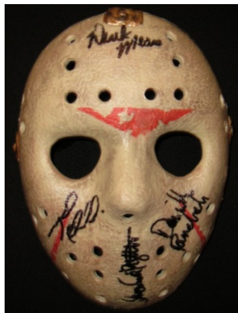
...и маска Джейсона из «Пятница 13-е». Найди 10 отличий .

« Лепрозорий [ < лат. leprosus прокаженный ] — лечебно-профилактическое учреждение для больных проказой ( лепрой ), занимающееся активным выявлением, изоляцией и лечением больных проказой, диспансерным наблюдением за контактировавшими с больными, организацией иммунопрофилактики и т. п. »