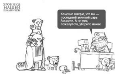
Те самые макаки.

Известен на лепре прежде всего своими макаками, которые эффективно сливали и накачивали рейтинг разным пользователям Суверенного Лепрозория. После Балканизации его обуяло кармодрочество. Борьба велась армией добровольцев («макак») путем сливов рейтингов одних пользователей и накачкой других. Лично Ашурбанипалу армией макак был накачан рейтинг 267953 и голос 8, что по меркам Суверенного Лепрозория чуть менее, чем дохуя . Справедливости ради стоит заметить, что недовольные сливами жители больнички слили карму Ашуре Асархаддоновичу до –1052 (состояние на пятнадцатое сентября две тысячи восьмого года), выразив таким образом свой гражданский протест и общественное порицание. По состоянию на 18 октября 2009 карма поцента составляет 540, что примерно соответствует его текущей значимости на Лепре.