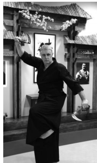
А еще он может так

Подервянский так же известен как автор украинской национальной идеи .