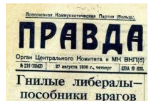
Даже спустя 80 лет либерасты остались пособниками врагов

<...> До сих пор во всем мире существует четкое противопоставление либералов как сторонников социального государства и консерваторов как адептов laissez faire - противопоставление, которое сложилось не менее ста лет тому назад. И только в России сторонников свободного рынка и ограниченного влияния государства на хозяйственную жизнь называют либералами, а ту группу, которая практически поставила всю экономику под контроль государства и его институтов, - консерваторами. При этом те, кто ввел столь экзотические понятия, удивляются, что их не понимают на Западе.