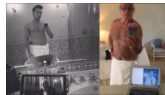
Самопиар — тяжелый труд.

В вожделенной Европе (и Израиле) подобные отбитые деятели тоже имеются. Только там аналогичная ниша оккупирована смелыми леваками, радикальными экологами и ещё какими-нибудь агендерными феминистами. Соответствующие издания забиты уже знакомыми проклятиями человечеству, которое угнетает палестинцев, коал и волнистых попугайчиков, а также быдлонарода, который ходит на работу вместо того, чтобы спасти тюленей Гренландии.