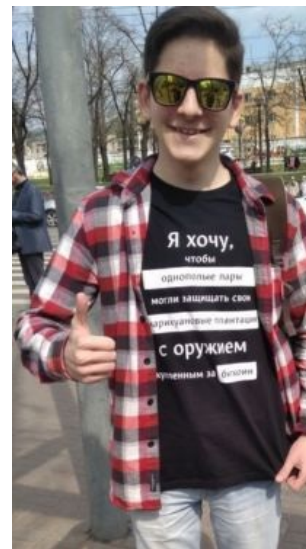
Молодой представитель — либертарианец