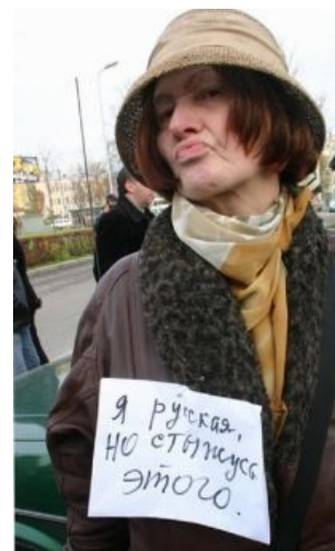
Старый представитель — демшиза

Дай ему в морду, и пусть разберется кулак. Мастер поймет, а дурак обойдется и так.