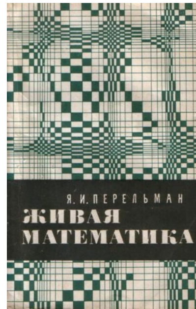
Та самая книга. 10 издание, 1974 год.