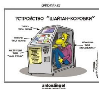
Шайтан-коробка такая коробка.