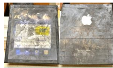
Деревянный iPad, только что из магазина

На дворе стоит 2007 год. Птички поют, солнышко светит, девочки юбочки задрали. К вам подходит на рынке парень — гопообразный , биланообразный , гастарбайтер , да хоть какой с виду. Говорит: «Хош купить телефон, Нокья N95, по дешману отдам, за чирибас, а ты потом его за 40 тысяч продашь!» На деле это никакая не N95, а наигрубейшая босотовая китайская подделка , похожая на него лишь внешне, да и то с расстояния пушечного выстрела. Данное изделие совершенно никакое по части аппаратного обеспечения, русский перевод прямо-таки дебильный как в инструкциях к шмоткам с рынка, устройство перестает работать через месяц, если повезёт. Обычно в первые два дня. А продавец имеет неплохой навар. Было замечено и в 2008 году, потом «волки-одиночки» переключились на босотовые копии Айфонов . К примеру . Сейчас подобного рода наглость в ДС практически вымерла, торгуют чайнапромом непосредственно с лотков в метро, так как клиентура пока находится. Но в замкадсках, например, на Урале и Санкт Петербурге, около центральных рынков ещё вовсю тусуются хачи и гопники с