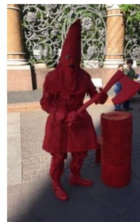
Деньги или жизнь