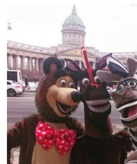
Из палаты мер и весов.