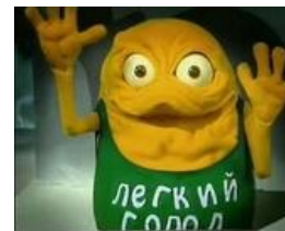
Лёгкий голод лёгок.

Лёгкий голод — игрушечный персонаж из рекламы творожка «Даниссимо», транслировавшейся в 2004—2005 годах. Благодаря весьма колоритному внешнему виду (плод яоя Джейка с Джаббой ) сделался популярен в интернете , например, как персонаж для фотожаб . Какое-то время существовала возможность выиграть подобную игрушку в конкурсе.