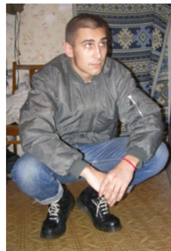
Добрый, патриотически настроенный студент

Про сабжа было написано немало высеров, которые на проверку оказывались чьими-то большими фантазиями или заказухой одесских левых. Хотя некоторые оказались правдой. На просторах сети были обнаружены несколько забавных фотографий одного из друзей Максима. В основном они посвящены