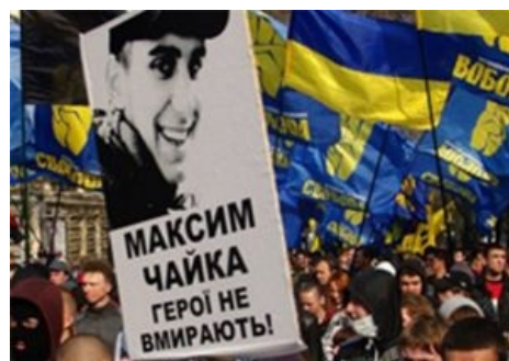
Герої не вмирають!