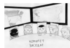
Комитет заседает — Новей выпиливат