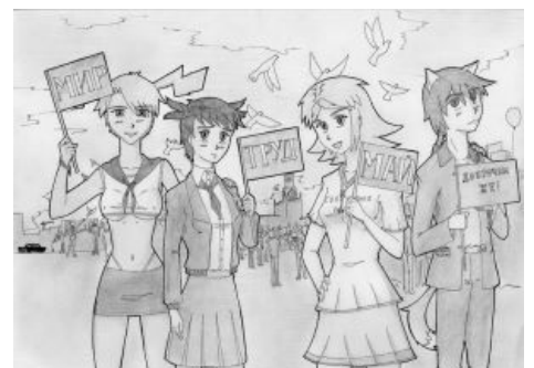
Мир, Труд, Май, Доброчан же

Неверно многими чанерами воспринимается как доброчановский художник, но это не так, несмотря на то, что официальные мангака-треды прочно поселились в /b/, а затем в /сг/ Доброчана, и Мангакой были созданы тонны доброчановского контента. На Доброчане был возведен в ранг полубога, но после пришествия новой ормтэшной администрации переругался с мод-кунами, за что бывал неоднократно бит банхаммером (и на момент написания статьи также находится в бане, что официальная администрация доброчана опровергает, ссылаясь на неведомые технические неполадки), да и былую популярность потерял в связи с переездом на Доброчан множества других художников, не уступающих ему в качестве воробья . Доставшееся чану от Мангаки и Менеджер-куна наследие — визуально оформленная страница 404. И сотни арта на тему доброчановских маскотов и мемов.