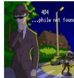
ФСБ-кун и педобир...

Был замечен повышенный интерес Мангаки к педобирам и центральным процессорам (енкомы, отдельные пикчи, раскрывающие суть ФСБ-кунов, длительная арка с технопедобиром), что как-бы намекает. Одна из главных особенностей его творчества — всепоглощающая любовь к майндфакам, которых он пихает по десятку штук на каждую страницу. До сих пор лишь малая их часть найдена. Приготовьтесь срать кирпичами. Мангака неоднократно был замечен в различных фагготриях. Хоролуб, куклоб, евафаг, Вассал Лямбдадельты , юкехейтер.