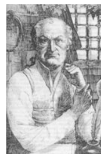
Маркиз де Сад с презрением смотрит на бездуховную чернь.