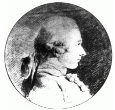
Donatien Alphonse François de Sade

Маркиз де Сад ( Донасьен Альфонс Франсуа де Сад , фр. Donatien Alphonse François de Sade ; 1740—1814) — французский писатель, философ, циник и дебошир, любитель театра и превосходный актёр, человек с противоречивым характером, буйной фантазией и добрым сердцем. Истинный аристократ, отпрыск древнего и знаменитого рода. Проповедовал освобождение человека от гнёта устаревшей морали и религии. Впрочем, предтечей сабжа можно считать жившего в 17 веке Джона Уилмота , по мотивам насыщенной жизни которого даже был снят фильм The Libertine , с Деппом и Малковичем в главных ролях.