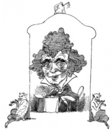
Карикатура на де Сада

«Но зачем тебе деньги, Жозефина? На тряпки? А мне они нужны на задницы, на мужские члены. Видишь, какая большая разница! »