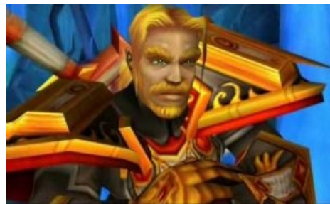
Блейзер из TotP III смотрит на тебя, как на Артаса

Полу-профессиональная машинима — самая редкая на просторах интернетов, так как требует многодневной кропотливой работы, и это только для «крепкого середнячка» на 5-10 минут. Однако встречаются исключения, достойные того, чтобы о них хотя бы знать.