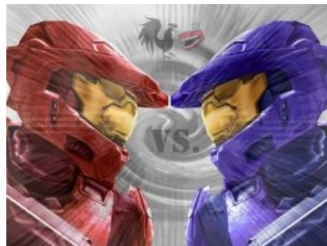
Red vs Blue — одна из наиболее известных машиним

Машинима ( Machinima , произв. от «Machine» — Машина и «Cinema» — Фильм) — любительский ролик, либо полноценный сериал или фильм, созданный фанатами некоторой компьютерной игры при использовании ресурсов графического движка последней. Большая часть аффтаров состоит из так нелюбимых дедами школьников и студентов, решивших совместить приятное с полезным, став в результате чем-то вроде самсебережиссёра , только круче. Некоторым это даже удается, однако учитывая то, что средний уровень скилла типичного энтузиаста колеблется на, мягко говоря, не внушительных уровнях, пришедших к успеху личностей машинимы к пряморукости почти всегда отсеивает особо упоротые экземпляры, делая ее чем-то вроде « элитного фанфика ». Точнее, так было раньше, всё же нанотехнологии сделали свое дело.