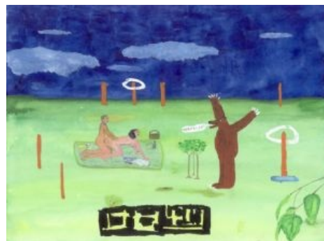
Оригинальная картина Джона Лурье