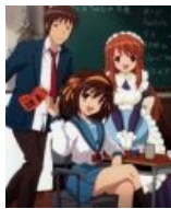
Кён случайно попал в кадр