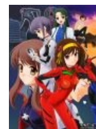
Neon Genesis Haruhilion