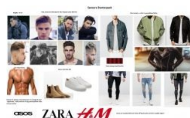
Гайд по стилю от форчановского /fa/

KAMON!!! - Метросексуал (Official Video) Вся суть мужского гламура