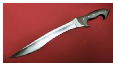
Копис. Найди 5 отличий от фалькаты/махайры