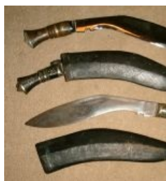
Кукри - расовый