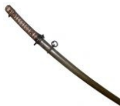
Гунто - расовый японский "нож" Второй Мировой.