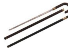
Для истинных дэнди

В XIX веке в кругах состоятельных господ распространились мечи-трости — шпаги или стилеты, носившиеся скрытно в трости, верхняя часть которой вместе с набалдашником служила рукоятью, а нижняя — ножнами. Это оружие широко применялось как для самозащиты, так и для преступлений, и даже вошло в оружейный комплекс савата .