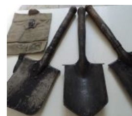
Малые пехотные лопатки

Алсо, гуркхи в британской армии носили свой традиционный мочет — кукри , который позволяет невозбранно рубить им как ятаганом или даже как топором. Носят и сейчас, но по понятным причинам в реальном бою данное оружие применяется чуть реже, чем никогда.