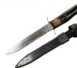
Младший брат и, по совместительству, убийца меча.

А во времена Второй Мировой меч перестал быть оружием и теперь используется лишь в парадном этикете. Хотя японцы юзали вполне себе полноразмерные син-гунто (пехотный меч), кай-гунто (морской меч), а порою даже катаны , с которыми первых два вида частенько путают, до 1945 года, когда Квантунская армия соснула хуйцов в борьбе с советскими войсками. В итоге весь цвет японского самурайства погиб под артиллерийскими атаками.