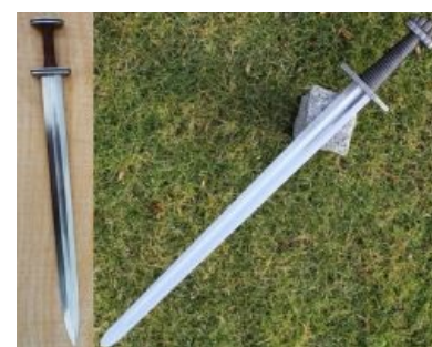
Вендельский (слева) и каролингский (справа) мечи

В самом конце поздней Античности, в VI — начале VII века, франки, завоевавшие Галлию, начинают осваивать там новые месторождения железа, что приводит к бурному развитию металлургии и открытию независимо от индусов фосфористых сталей. Тогда же производство булата проникает из Ирана в Среднюю Азию, в частности, в Мерв в современной Туркмении, а позже и на территорию нынешнего Узбекистана. Другие технологии Античности также получают распространение. Благодаря арабам в Азии (а позже в Испании и Византии) начинают широко применяться классические высокие штокофенные печи (т.н. «каталонские горны», использующие меха с водяным или ветряным приводом), мечи всё чаще подвергаются закалке и отжигу. Появляются и популярные, узнаваемые бренды, в первую очередь +VLFBERH+T , или +VLFBERHT+ , — харалужные или из тигельного булата высококачественные мечи, ковавшиеся рабами одного из франконских монастырей [2] . Разумеется, тут же появляются и « абибасы » с клеймами типа +VLEBERHIT , +VLFBENT+ , +VLFBERH+ и т. п., а также «бюджетные отечественные аналоги» из импортных комплектующих , типа англосаксонского + LEUTLRIT , пользовавшегося немецкими клинками.