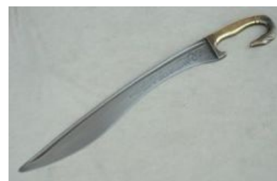
Фальката или махайра

Между тем приблизительно к XII в. до н.э. выяснилось, что некоторые углеродистые сплавы железа, выделяющиеся серебристо-серым цветом на тёмном фоне крицы , обладают более высокой прочностью и упругостью, чем окружающее их сыродутное железо, загрязнённое кучей примесей и бедное углеродом. Однако при тогдашнем уровне развития металлургии получить сплав с нормированным содержанием углерода и примесей было практически невозможно, и результат очередной плавки даже очень опытный кузнец мог предсказать лишь крайне приблизительно. Только по окончании процесса можно было разобрать, какие сплавы получились — низкоуглеродистые, отличающиеся мягкостью и упругостью (и непригодные для закалки), или высокоуглеродистые, с плохой ковкостью (сравни с чугуном), но высокой прочностью и жёсткостью — если уж согнулись, то с концами. Поэтому использовались те же решения, что и ранее для бронзы: