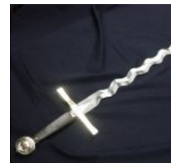
Меч для отжига.