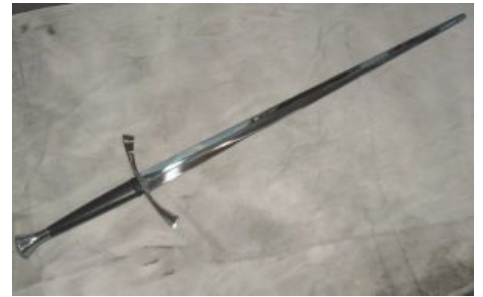
Полуторный меч, он же бастард.