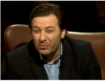
Минаев видит в тебе ДухLess

и он сам. По сути весь пересказ. В конце персонаж философски самоликвидируется , что при других обстоятельствах могло бы доставить, но... В довершение кинуть ложку говна: феерически похоже на «99 Франков» «Faserland» Кристиана Крахта.