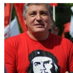
Олег Воронин, истинный коммуняка, миллиардер и просто поклонник Че

До 5 апреля — 8 лет коммунисты у власти. Демократия есть, но её вроде и нет. Партий много, но в 95% ящиков показывают только одну. Но если всё же показывают других политиков — то только в контексте «фошывствующих элементов желающих уничтожить молдавскую государственность охраняемую мудрейшим лидером коммунистов Ворониным» (параллельно являемся отцом одного из самых богатых людей в Молдове — Олега Воронина, который очень непалеонно стал таковым именно в годы правления папы). Хотя эффекты набирающего обороты мирового кризиса уже ошумили, масс-медиа промывает мозги народу что Молдова он не коснётся благодаря гениальнейшей команде экономистов на службе Партии, команде у которой должны учиться эти ваши специалисты из СПШ, МФФ и т. д. © В.Воронин. Международные отношения с Европой и Россией в жопе. Повсеместно распространён мусорской произвол.