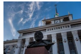
Ещё немного Тирасполя

«— Построение в части. Комбриг осматривает пополнение звездных духов