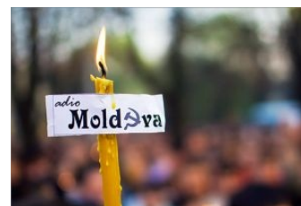
6 апреля, вечер (перевод текста на листке: "Прощай Молдова")