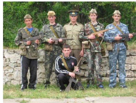
На страже суверенитета!

Молдавская милиция Человек, которого раздражает незнание полицейскими своих правил. На юге Молдовы.