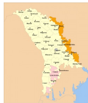
Маленькая, но гордая

Нямка. Вельма жирна, питательна, вкусна и остра. Острый стручковый перец на обед под борщ — рядовое явление. Кто не знаком ни с одной восточной кухней, может получить сначала ожог глотки, а потом сжечь унитаз . Желающим приобщиться рекомендуется соус табаско в малых дозах, не торг, но все одно лучше. Едят все, в том числе и свинядину. Но самый эпик вин — это так называемая «манджя». Огромный котел полный густого мясного соуса и собсна мяса. Делается только из птицы, но из гуся самый чимес. К этому обязательно идет домашний хлеб, огромными ломтями которого макают соус из тарелки, а мясо уже руками, вино, over9000 разных гарниров и «туршу» — фаршированные капустой с морковкой болгарские сладкие перцы заквашенные в бочке с помидорами, специями и все это залито кипящим маслом с жареным луком. Ценители квашенки сойдут с ума. Плов настоящий, только из барашка. Муждей и брызга также в ходу. Как и у молдаван высоко котируется домашнее вино, впрочем остальное тоже пьется.