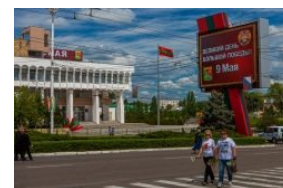
Тирасполь, столица ПМР

https://www.youtube.com/watch?v=4jYESn2t-UU https://www.youtube.com/watch?v=35nOicMf4Ng Владимир Путин о судьбе Приднестровья. 'Прямая линия' с Президентом РФ (17.04.2014)