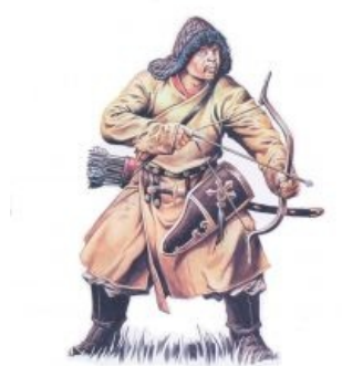
Злой монгол ползёт на берег , наточив

Монголы, придя уже огромным войском (около двухсот килосолдат, которых вели три сына Чингисхана, каждый из которых хотел взять Гургандж раньше своих братьев), начали долбиться об стены. Гарнизон и ополченцы их с удовольствием расстреливали со стен. Каждый штурм оборачивался кровавой баней. Проебав 50 тысяч на троих, братья сменили тактику и начали обстреливать Гургандж из китайских метательных орудий. Но тут выяснился главный лулз: камней-та не нашлось! Бомбардировки закончились уже на следующий день. (Позднее какой-то хитрожопый китаец придумал вырубать снаряды из дерева, и, вымачивая их в