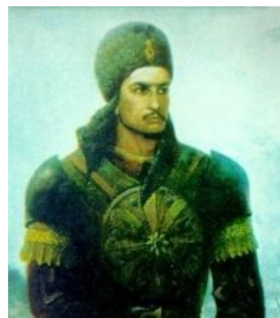
Джелаль-эд-Дин размышляет о будущем своей Родины