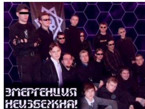
Секта в сборе.