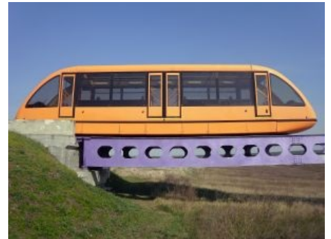
В Укрии была демо-версия двойного монорельса