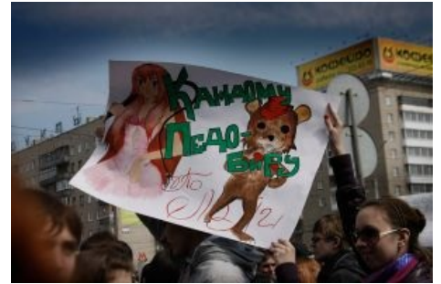
Монстрация-2010: «Каждому Педобиру по лол!»

Однако и сам вскоре не удержался и начал бурно защищать Pussy Riot . Так что ждать новых гонений на монстрантов и Лоскутова пришлось недолго: [1], [2].