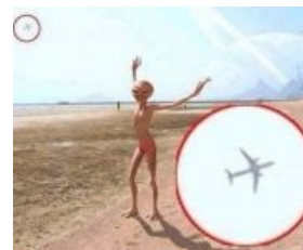
В другом измерении