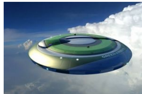
Вундервафля на марше

НЛО обстрелял талибов в Афганистане! (Стоит посмотреть!) НЛО стреляет по талибам