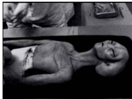
Расовый пришелец. По последним данным — из силикона

И это при том, что за последние 10 лет в мире во много раз возросло количество людей с цифровыми фотоаппаратами и сотовыми телефонами-видеокамерами в кармане, таким образом, количество качественных видеороликов и фотографий НЛО, сделанных очевидцами, также должно было возрасти в несколько раз. Но ничего этого пока нет. В отличие, например, от совершенно неиллюзорного Челябинского метеорита , который был заснят разом на десятки, если не сотни камер.