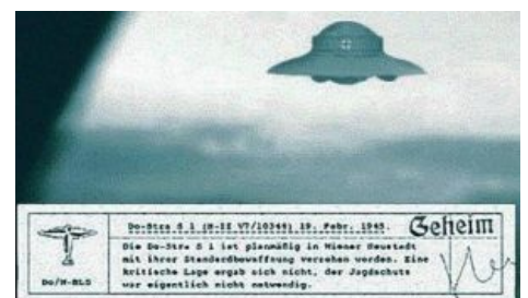
НЛО Гитлера. Фейк