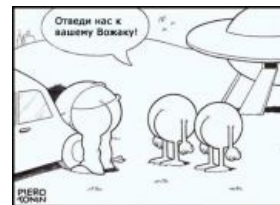
Инопланетяне бывают разными