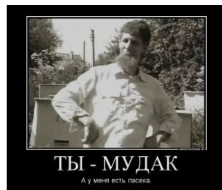
Ливер и пчелки

Творчество НОМ характеризуется иронично-глумливым взглядом на вещи и чуть более чем значительной долей абсурда. Некоторые называют НОМ русским «The Residents» и Monty Python .